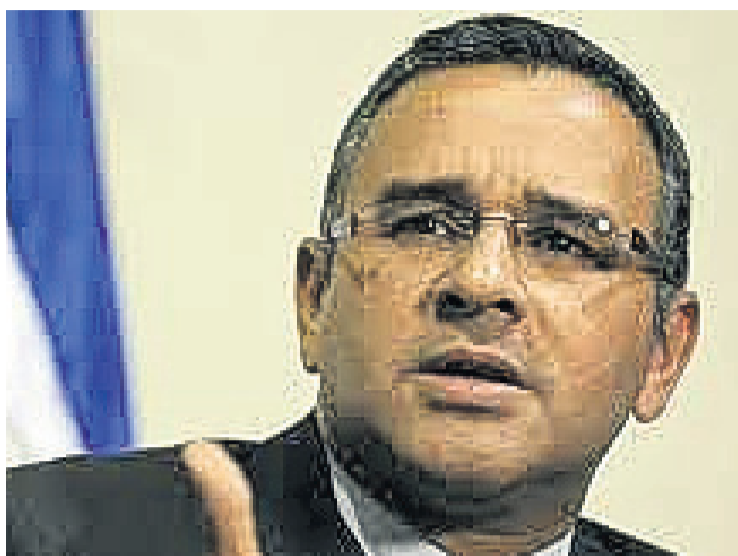
(ElPais) – Ex-presidente Salvadoreño Mauricio Funes atopa cu acusacion nobo di corrupcion. Funes, cu a goberna entre 2009 y 2014, supuestamente a

laba 3,5 miyon dollar di placa di estado malversa via empresanan ‘fachada’ na El Salvador, Panama, Suiza, Islanan Marshall y Curaçao, asina Fiscalia di e pais a anuncia diabierna pasa.